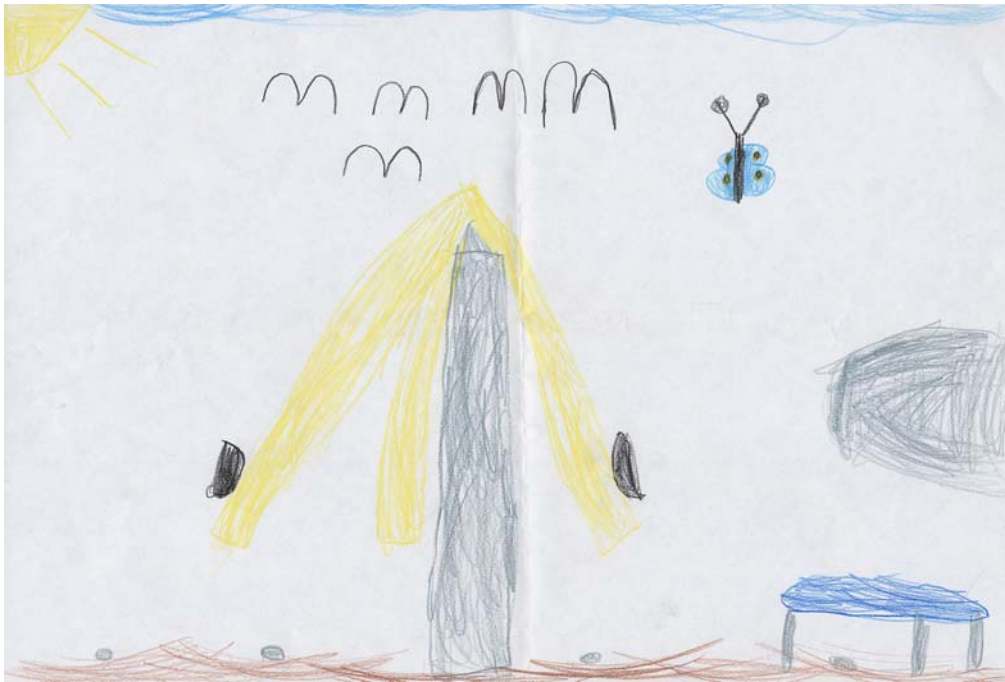
Kuva 1. 5- vuotiaan Kristan piirtämä kuva lammesta ja leikkipaikasta. Lampi on kuvassa oikealla näkyvä harmaa alue.

Lapset eivät kokeneet lammen ympäristöä pelottavaksi paikaksi, vaan alue on heidän mielestään mukava leikki- ja retkeilypaikka. Huvimaja oli yleisen mielipiteen mukaan mukava pii- lo- yms. oleskelupaikka. Huvimajalla ei kuitenkaan ollut suurta merkitystä lasten mielestä. Huvimaja oli lasten mielestä ihan kiva, mutta ei välttämätön. Roskaamisesta ei pidetty ja lap- set kutsuivatkin roskaajia sottapytyiksi.