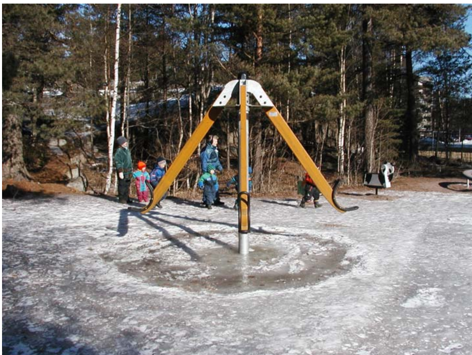
Kuva 2. Lasten leikkipaikka Mustalammen vieressä

Hoitohenkilökunnalla ei ollut varsinaisesti mitään mielipidettä, koska he asuivat muualla. Suuremmaksi ongelmaksi koettiin päiväkodin lähellä oleva kioski, josta nuoret tulevat ros- kaamaan päiväkodin pihalle viikonloppuisin. Ohjaajat ovat käyneet lasten kanssa lammella retkellä. Lammen ympäristö on usein lasten leikkipaikkana. Huvimaja oli hyvä paikka syödä eväitä.